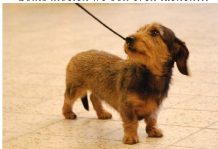
Doe ik het goed baas?