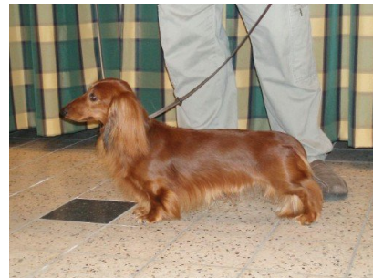
Aan de losse lijn in stand

Als de keurmeester klaar is met uw hond zal hij u vragen om weer in de rij plaats te nemen. Als uw hond niet aan de beurt is, blijft u dan wel aandachtig met uw hond bezig. Zorg dat u zelf in de ring blijft en houdt u zich bezig met uw hond. Ga niet staan kletsen met mede-exposanten, hoe gezellig dat ook lijkt, dit kunt u buiten de ring doen. Uw hond mag best even gaan liggen of zitten, dat is nog altijd beter dan dat hij/zij slecht in stand staat. Sommige exposanten gaan door de knieën en zetten de teckel in stand. Het is beter om uw teckel zelf te laten staan uit de losse hand.