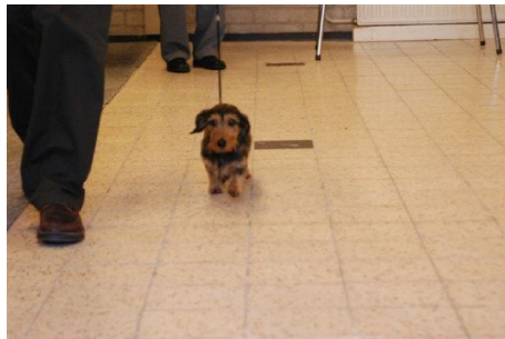
Recht op en neer lopen