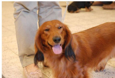
Soms moeten we ook even lachen...