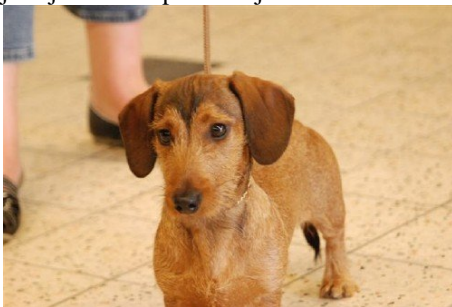
Ik kan het heel goed hoor...