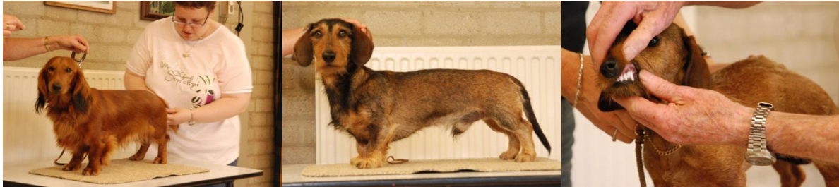
Op tafel betasten

Een keurmeester zal u altijd vragen om uw teckel op de tafel te plaatsen. U zet uw teckel dan op tafel, staand op alle vier de benen, met de zijkant naar de keurmeester en u gaat uiteraard zelf achter uw hond staan. U moet er namelijk altijd voor zorgen dat uw teckel tussen u en de keurmeester is, het gaat de keurmeester immers om de hond. Op de tafel zal de keurmeester voelen hoe de hond gebouwd is en zijn gebit bekijken. Zorgt u ervoor dat uw teckel dit goed toelaat.