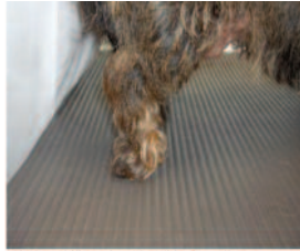
Afbeelding 1: Dubbeltreden.